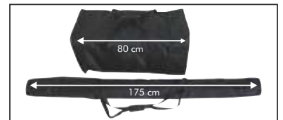
inkl. Tragetaschen als zweckmäßige Transportverpackung