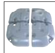
Wassertank kann zum Transport in vier handliche Teile zerlegt werden